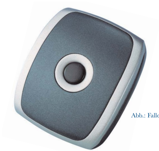
Abb.: Falldetektor FD 100

Der Falldetektor FD 100 ist durch modernste Technologie in seiner Art und Arbeitsweise einzigartig.